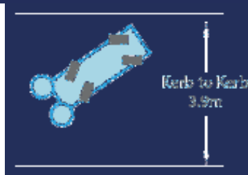
Obrysový průměr otáčení 3,9 m